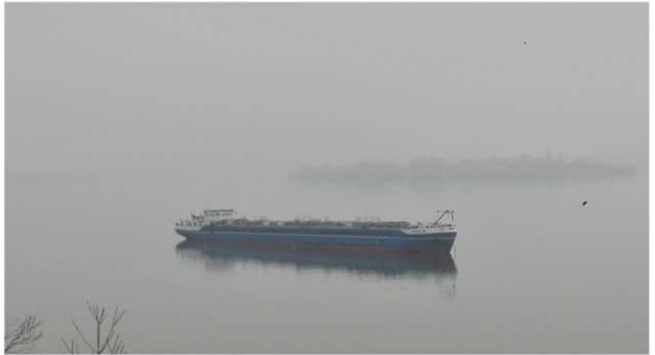
Museo storico di Severin sulle rive del Danubio