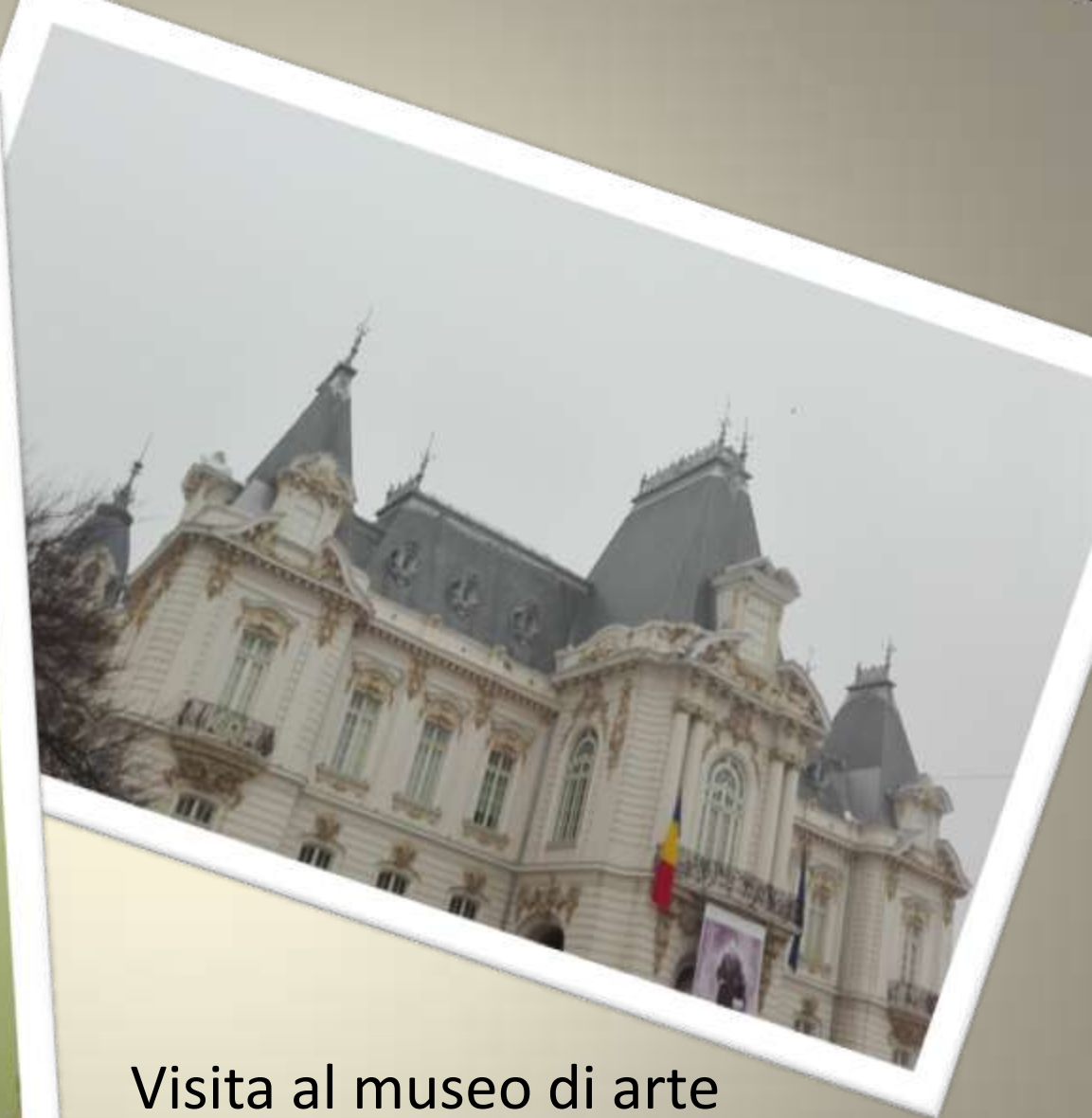
Visita al museo di arte Craiova