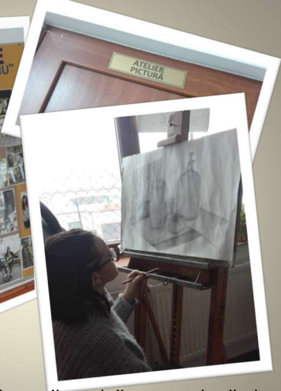
Visita al liceo artistico di Targu Jiu e della sua sala di pittura