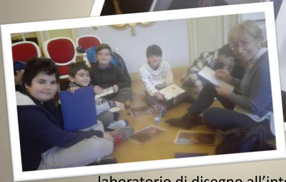
laboratorio di disegno all'interno del museo di arte